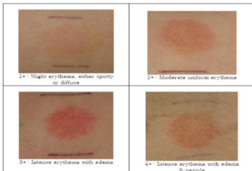
<Fig 1. Clinical standard photographs of visual assessment for human patch test>